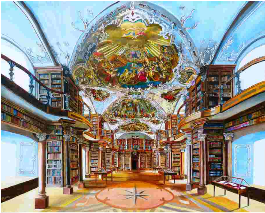
Biblioteca Kloster San Gallen 162x130