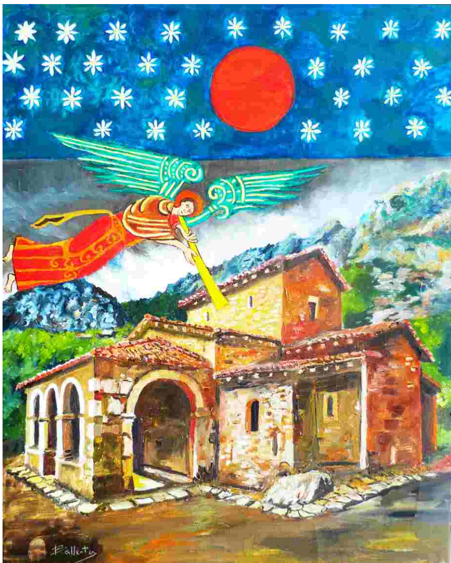
Ermita de Santa María de Lebeña 50x60 cm.